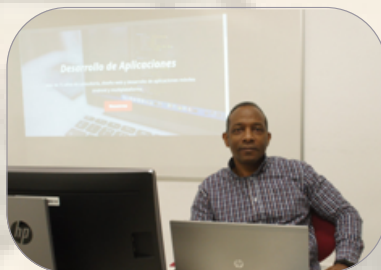
Entrevista para La Voz de Almería

Durante el periodo de adaptación, enfrenté desafíos profesionales, como aprender los Sistemas Ofimáticos novedosos de aquella época, pero por proceder de una ex Colonia Española, no tuve grandes problemas de tipo culturales. Integrarme en la sociedad local y entender las costumbres llevó un tiempo, pero con paciencia y predisposición, logré superar esas pequeñas barreras. Mi formación académica previa en matemáticas e informática también me ayudó a afrontar los retos laborales con éxito.