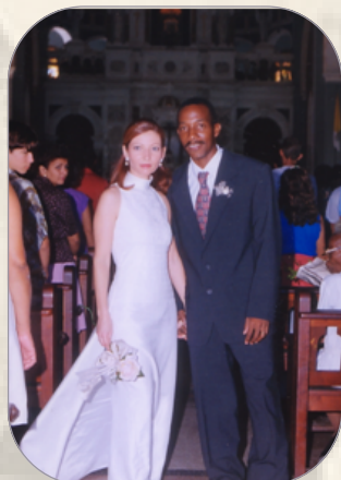
Día de su boda

No, no me arrepiento de haber venido a España. A pesar de los desafíos, la experiencia ha sido enriquecedora y llena de aprendizajes. La oportunidad de construir un futuro aquí sigue siendo valiosa para mí, especialmente después de haberme casado con una española.