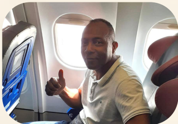
Vuelo a Santiago de Cuba