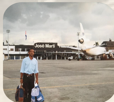
Día de su salida de Cuba a España

Aunque estaba preparándome para recibir un curso de Doctorado en la Complutense de Madrid, antes de conocer a mi esposa, la verdad es que, no tenía ni idea de que viviría indefinidamente en España, y muchísimo menos que sería nacionalizado español, formaría un hogar, con dos hijas preciosas y mi querida esposa, desde 1996 hasta hoy.